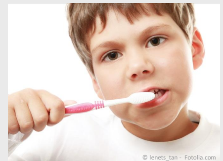
Bei der Prophylaxe lernen Ihre Kinder die richtige Zahnpflege.

Es gibt also keinen Grund, warum Sie auf Prophylaxe für Ihre Kinder verzichten sollten.