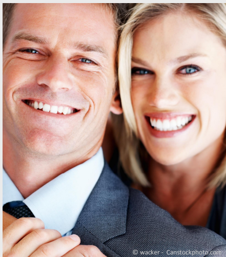
Selbstsicher mit gepflegten Zähnen

Dann werden Mund, Zähne und Zahnfleisch untersucht. Die Zahnbeläge werden angefärbt, um sie besser sichtbar zu machen und es wird die Tiefe der Zahnfleischtaschen gemessen.