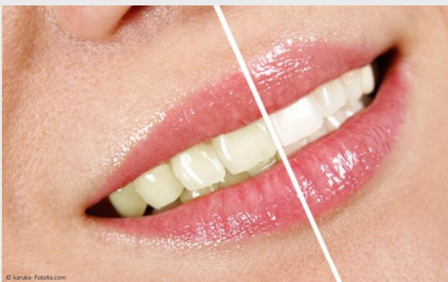
Deutlicher Unterschied: Professionelles Bleaching beim Zahnarzt wirkt!

Vertrauen Sie Ihre Zähne besser Profis an!