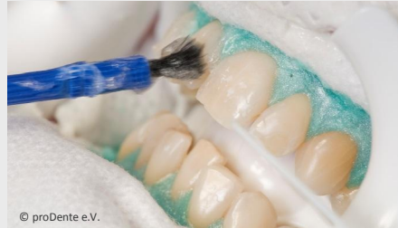
Power-Bleaching beim Zahnarzt: Auftragen des Bleaching-Gels

Wenn Sie die Praxis wieder verlassen, können Sie sich an sichtbar helleren Zähnen freuen!