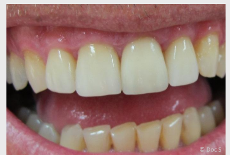
Veneers der oberen vier Schneidezähne 12 Jahre (!) nach dem Einsetzen

Wenn Sie sich schon lange ein perfektes Lächeln wünschen, dann sprechen Sie uns an!